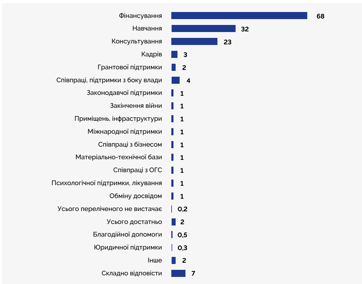
Графік 2. Розподіл відповідей респондентів на запитання: «Укажіть, будь ласка, якої зовнішньої підтримки вам не вистачає для посилення спроможності?», %