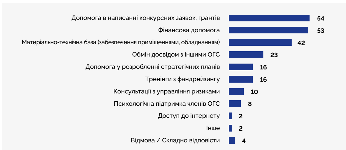
Графік 3. Розподіл відповідей респондентів на запитання: «Яка ще додаткова підтримка вам була б у пригоді?»

Особливу підтримку в питаннях матеріально-технічного оснащення потребують організації на сході країни – 63%, а допомоги у розробленні стратегічних планів – ті організації, які перемістились – 27% (проти 16% серед усіх опитаних).