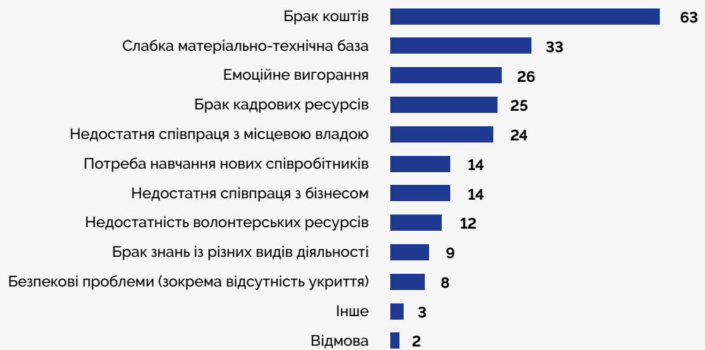
Графік 4. Розподіл відповідей респондентів на запитання: «Оцінюючи поточний стан організації, які внутрішні проблеми ви спостерігаєте зараз найчастіше?», %

За результатами опитування організації зазначили такі актуальні для них внутрішні та зовнішні проблеми.