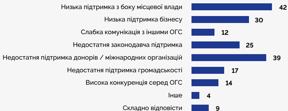
Графік 5. Розподіл відповідей респондентів на запитання: «Оцінюючи поточний стан організації, які зовнішні проблеми ви спостерігаєте зараз найчастіше?», %

Примітно, що брак коштів найбільше відчувають організації, які були створені у 2022–2023 роках (74% порівняно з 63% серед усіх опитаних), а найменше ті, хто працює від 2001 року. Натомість вищий показник емоційного вигорання зазначили представники організацій, які були створені від 2012 по 2021 роки. Також емоційне вигорання більше притаманне тим організаціям, які зараз є релокованими.